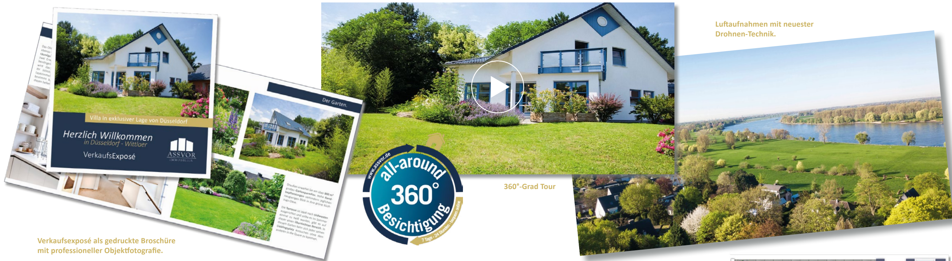
Verkaufsexposé als gedruckte Broschüre mit professioneller Objektfotografie.